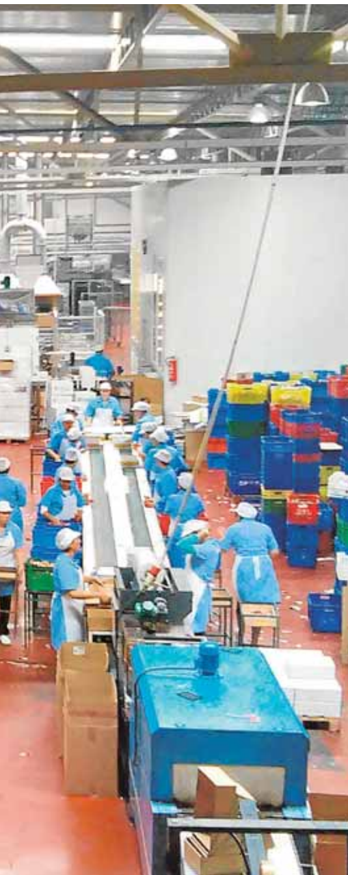
dan empleo a casi toda su población B.MORENO

una campaña de concienciación para que los alumnos de Primaria aprendan la importancia de reciclar vidrio. Los escolares de todos los centros educativos ursoanenses participarán en esta jornada informativa a partir de las 9.30 horas.