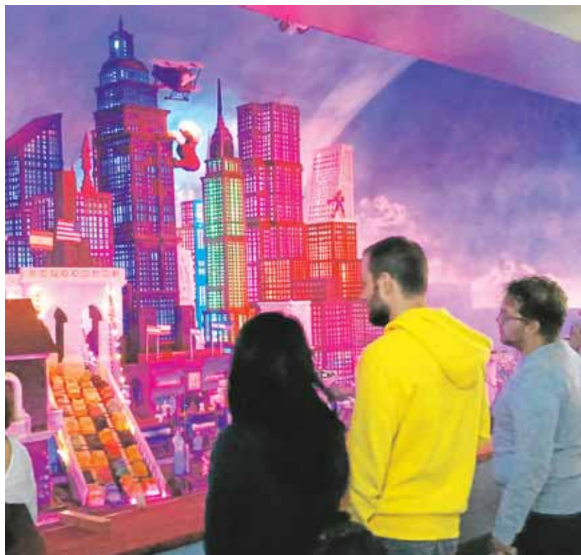
Visitantes observan la ciudad de chocolate de La Estepeña

Galván explica cómo la Estepeña apostó hace ya casi 20 años por añadir a sus productos el trabajo con el