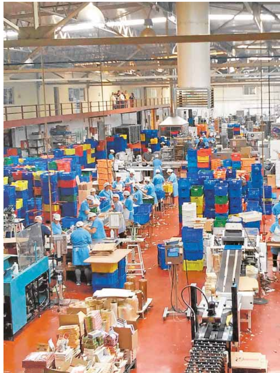
Durante la campaña navideña, que empezó en septiembre, las 19 fábricas de Estepa

Si todo el proceso para alcanzar esta calificación ha sido largo y exhaustivo, los beneficios que traerán merecen la pena. «Para nosotros es el reconocimiento a un producto excelente, de