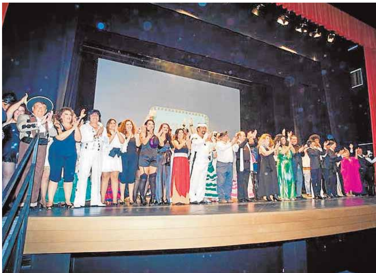
«Mitos de la música» sube al escenario a más de setenta personas durante el espectáculo

aspectos, esta nueva ordenanza normaliza el paseo de caballos y enganches, limita el nivel de ruido a 95 decibelios, obliga las casetas de más de 100 metros a adaptar los aseos para discapacitados y regula la concesión de casetas fuera del periodo de feria.