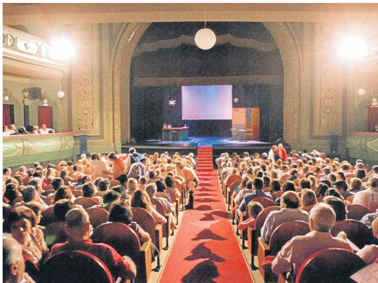
El Teatro Cerezo se llena en todas las funciones del Festival del Humor

Hoy los miembros de algunas de las compañías que más veces han acudido mantienen una gran amistad con los miembros de la Peña y su visita a la ciudad se convierte en varias jornadas de convivencia. La carga de lotería y aceite de Carmona acompaña siempre al atrezzo en su vuelta a casa. Eso y la satisfacción de haber dejado en Carmona un buen puñado de risas para condimentar el guiso de humor que se cocina en el perol de los organizadores.