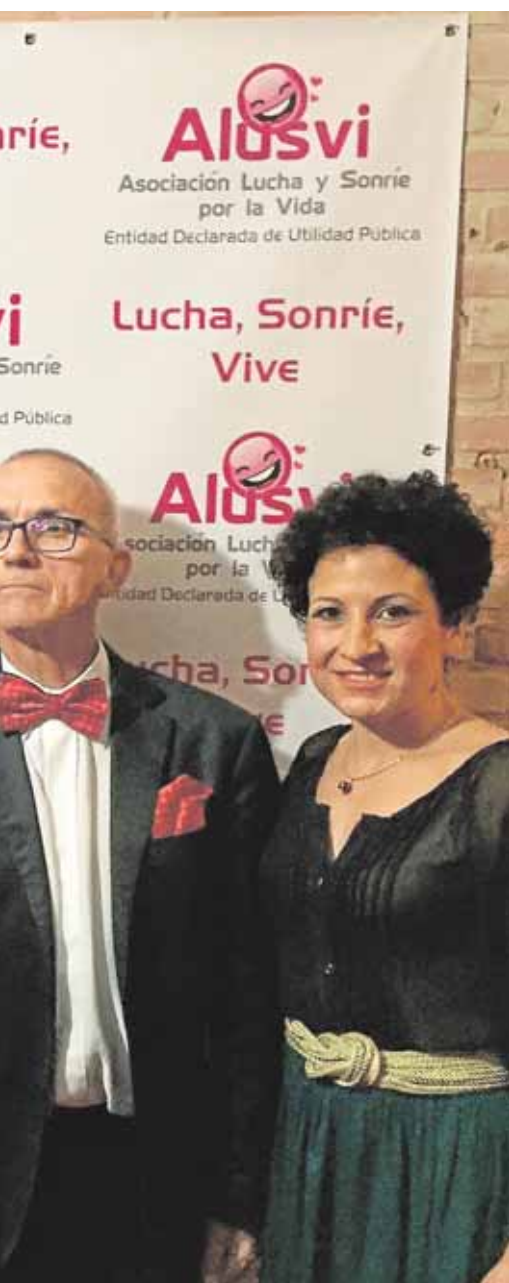
durante la presentación del calendario D.C.

mama. Entre todos los asistentes al evento, han creado un árbol lleno de palabras positivas que, tras la celebración de este acto, ha quedado en el patio del Ayuntamiento durante toda esta semana para que pueda seguir llenándose de mensajes.