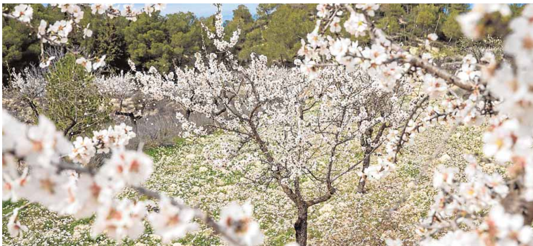
Se precisa de una media de tres años para que el cultivo del almendro dé sus frutos y empiece a ser productivo

disfrutar de una gran variedad de aves, en el Salón de La Huerta. La entrega de premios se realizará el domingo 25 de octubre. El evento está organizado por la Asociación Ornitológico-Cultural fontaniega, el Ayuntamiento y la Diputación Provincial.